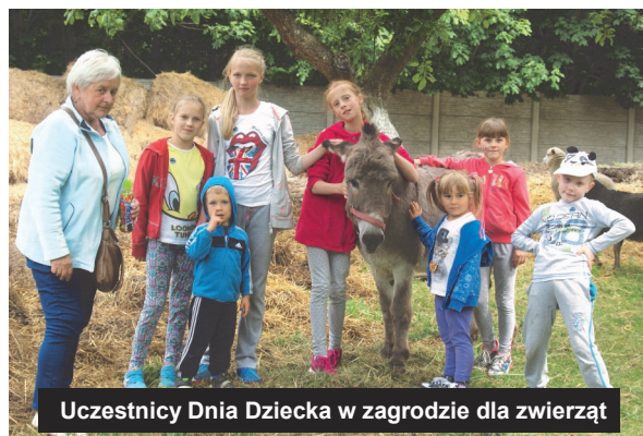
Uczestnicy Dnia Dziecka w zagrodzie dla zwierząt

Drugi Dzień Dziecka organizowany przez Stowarzyszenie na rzecz wspierania aktywności lokalnej w Gminie Dolsk wspólnie z Duszpasterstwem Dzieci Jutrzenka możemy z całą pewnością zaliczyć do udanych! W imprezie, której celem jest przede wszystkim integracja rodzin poprzez wspólną zabawę i rekreację, wzięło udział prawie 90 osób. Dzieci obejrzały przedstawienie pt. "Złotowłosa Bunraku", po czym rowerami przemieściły się z Dolska do skansenu filmowego Soplicowo. Oprócz aktywnie spędzonego czasu i miłych wspomnień dzieciaki otrzymały upominki, dyplomy i pamiątkowe medale. Więcej na www.dolsk.info.pl .