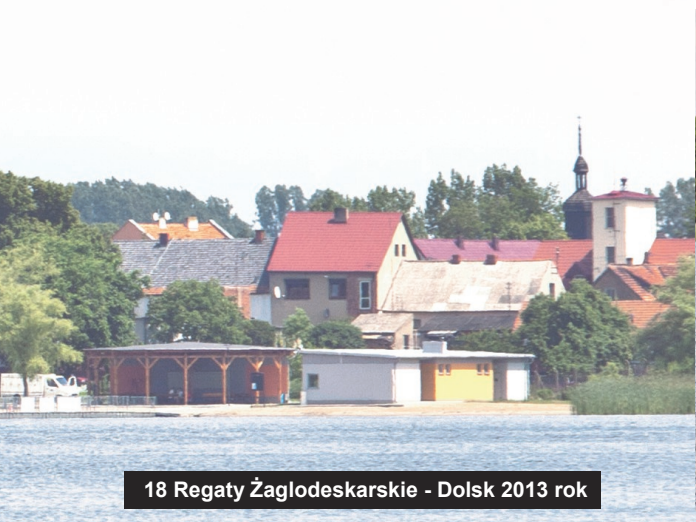
18 Regaty Żaglodeskarskie - Dolsk 2013 rok